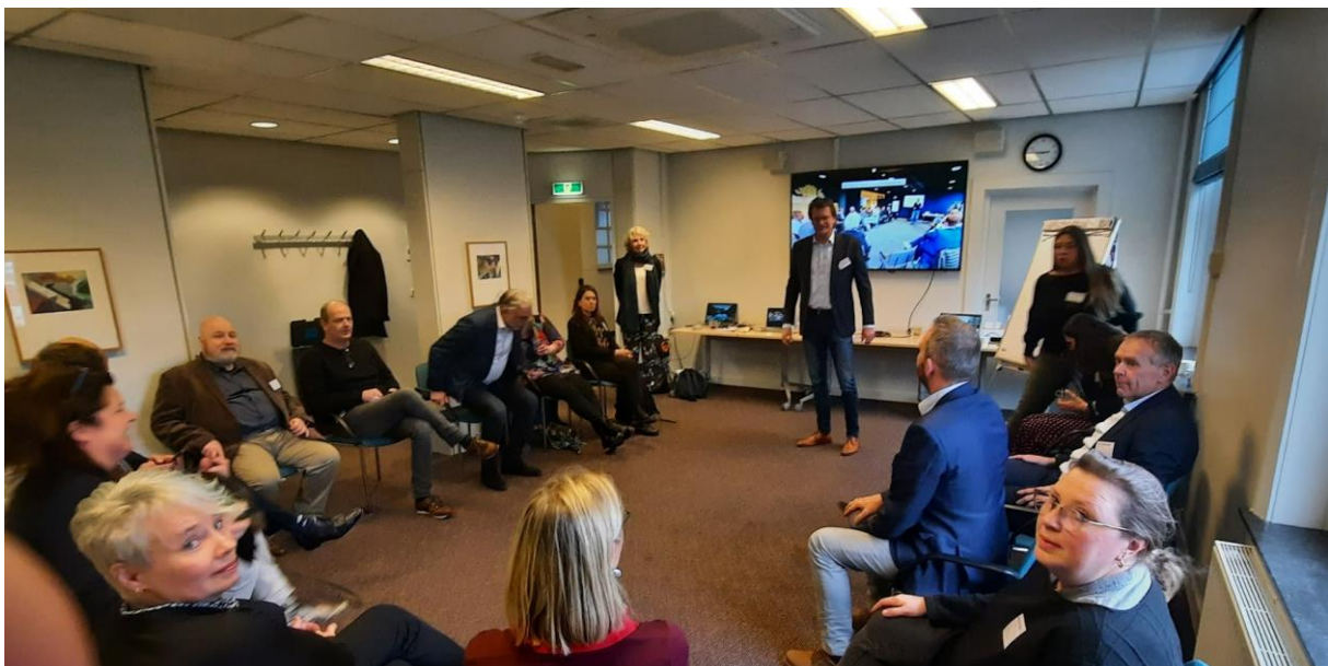
Bijeenkomst van de positieve duurzaamheidsdenkers.

Een voorbeeld is b.v. de BTG Voeding, Groen en Gezondheid. Zij hebben de groep van positieve duurzaamheidsdenkers in het leven geroepen en houden daarover bijeenkomsten.