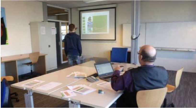
De solar heaters van de ICT-ers