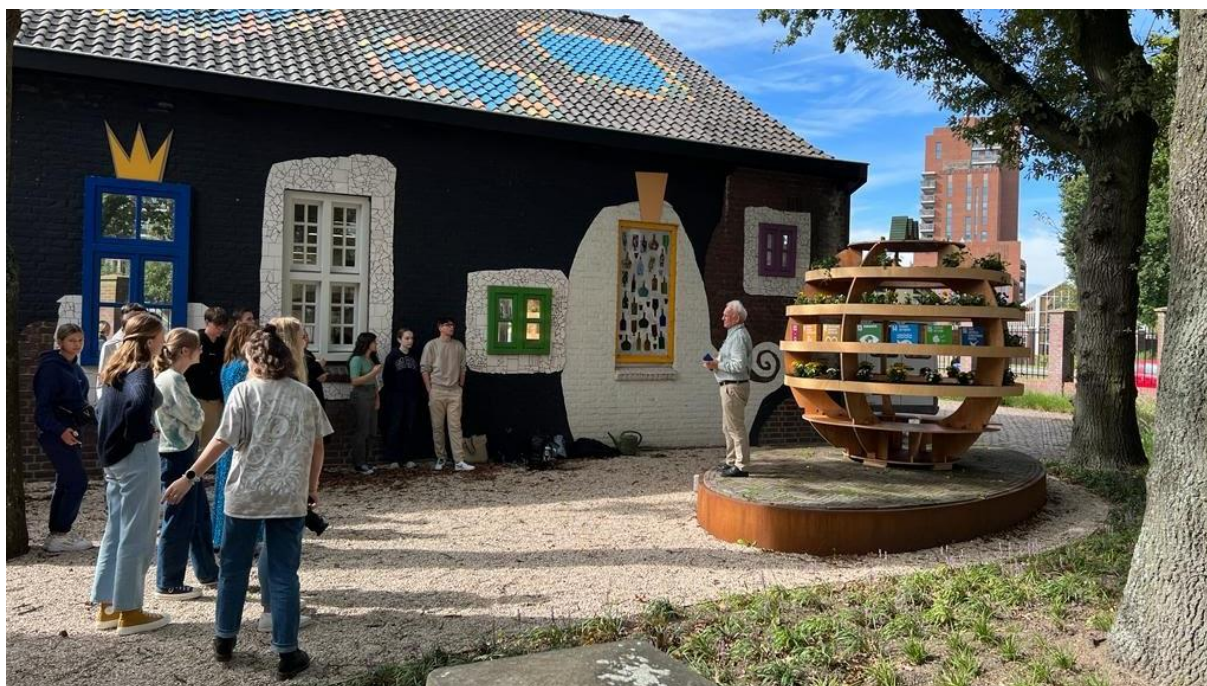
Hele docententeams worden geschoold in de SDG's en ze kiezen de 9 belangrijkste voor hun opleiding.