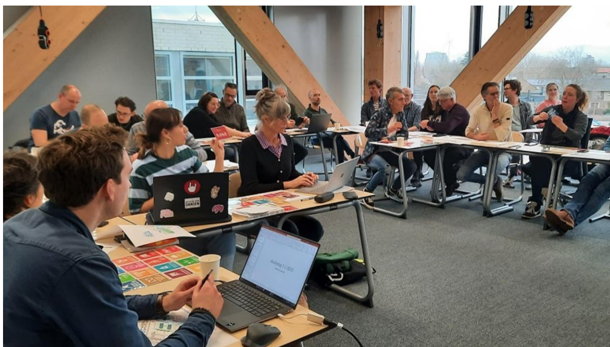
Bouwen en wonen, handel en commercie en de middelbare horecaschool hebben al hun eigen banner.