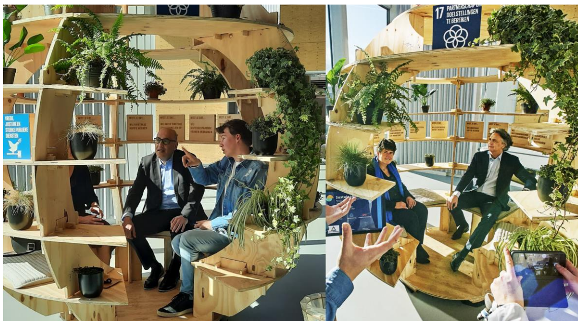
De voorzitter van de MBO-raad en de Commisaris van de Koning te gast in de SDG inspiration bubble.