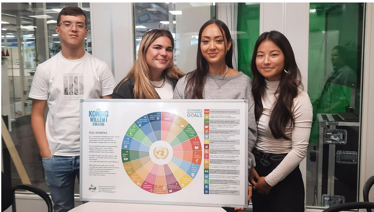
We hebben nu een SDG bubble buiten staan op een plek die veel gezien wordt. Hij krijgt nog verlichting.