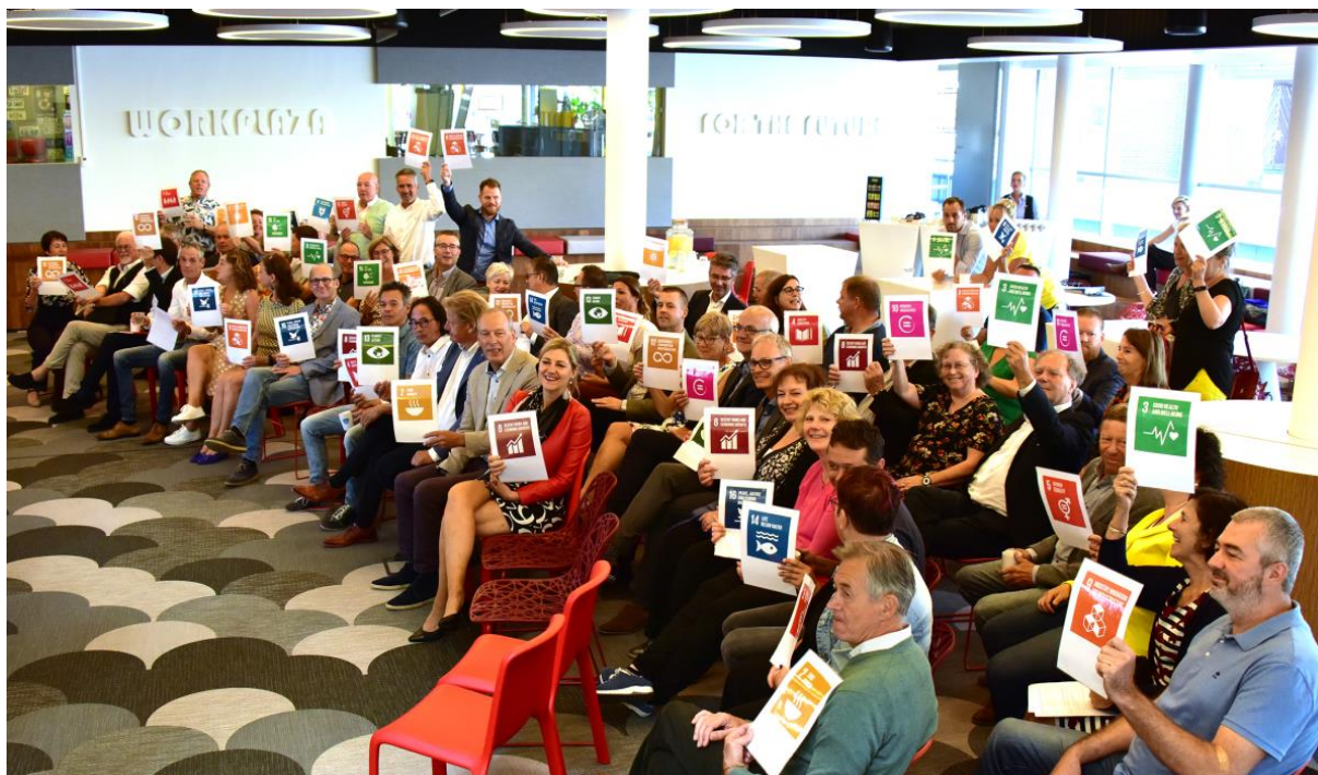
Overall in de school zie je de SDG's. We hebben SDG inspiration bubbles, magneetborden, vlaggen, banners etc.