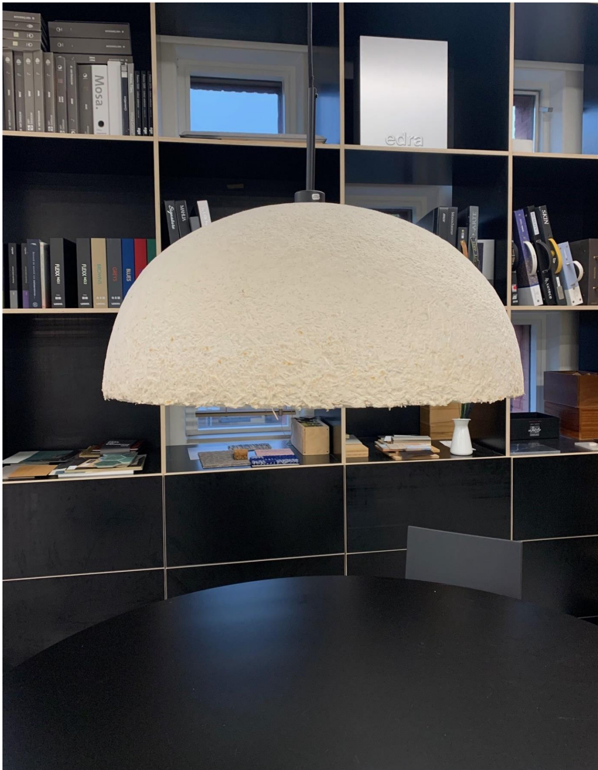
Een lamp uit mycelium.